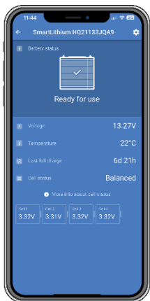
Appen Victron Connect

Victron Energy Lithium Battery Smart-batterier är litiumjärnfosfatbatterier (LiFePO 4 ) och finns i 12,8 V eller 25,6 V i olika kapaciteter. De kan kopplas i serie, parallellt och serie/parallellt för att skapa en batteribank för systemspänningar på 12 V, 24 V eller 48 V. Det maximala antalet batterier i ett system är 20, vilket ger en maximal energilagring på 84 kWh i ett 12 V-system och upp till 102 kWh i ett 24 V 1) och 48 V 1) system.