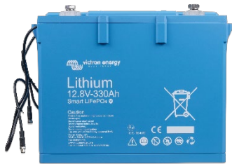
12,8 V 330 Ah LiFePO4 batteri